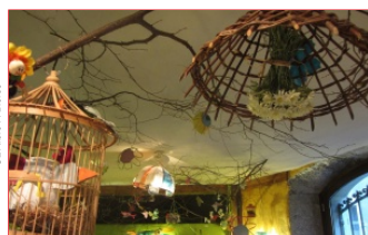
L'ARBRE À BIÈRES

20 avenue des Ducs de Savoie - 73000 Chambéry Tél. 07 83 09 73 38 corsaire.chambery@gmail.com www.corsaire-chambery.com/